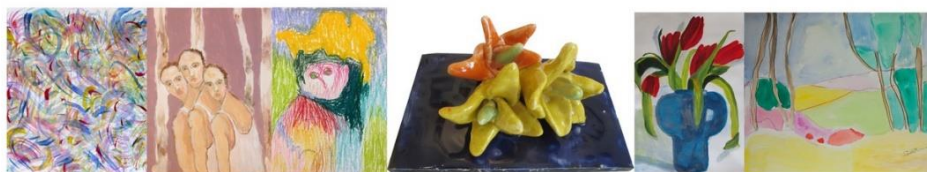
Uitnodiging voor de Nieuwjaarsborrel 2019 in ons atelier

Het team in Amsterdam bestaat naast de vier free-lance kunstenaars uit een groep van inmiddels 25 toegewijde vrijwilligers en een coördinator. Er wordt volop gebruik gemaakt van de groeiende expertise van alle mensen die betrokken zijn bij het atelier. We begonnen we het nieuwe jaar met onze inmiddels traditionele gezellige nieuwjaarsborrel voor alle medewerkers en het bestuur van de Stichting.