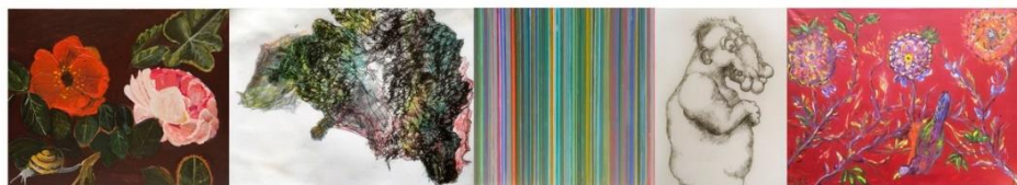
op 17 Januari aan de Brouwergracht 222 om 16:30 uur.