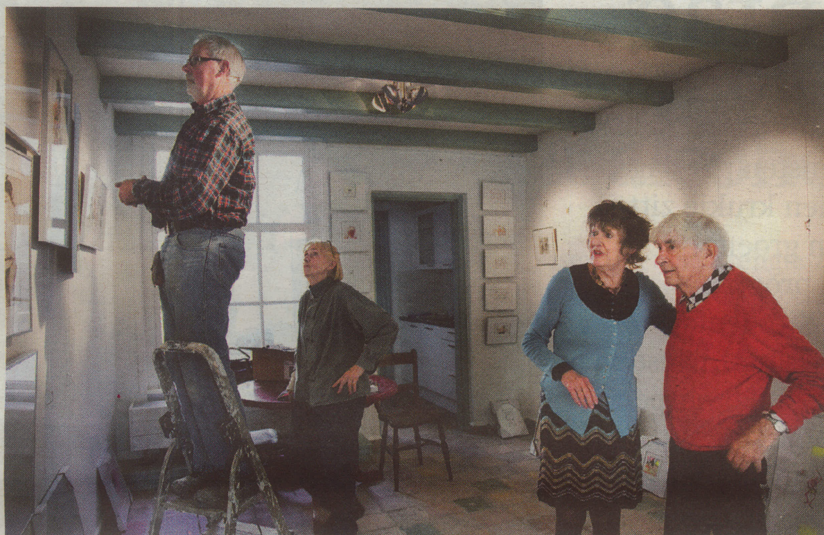
Aatje Veldhoen (rechts) met partner Hedy d’Ancona in Galerie Marline Fritzius.

Typerend is dat zijn hersenen hem moeiteloos lieten overschakelen van rechtshandig naar linkshandig, maar