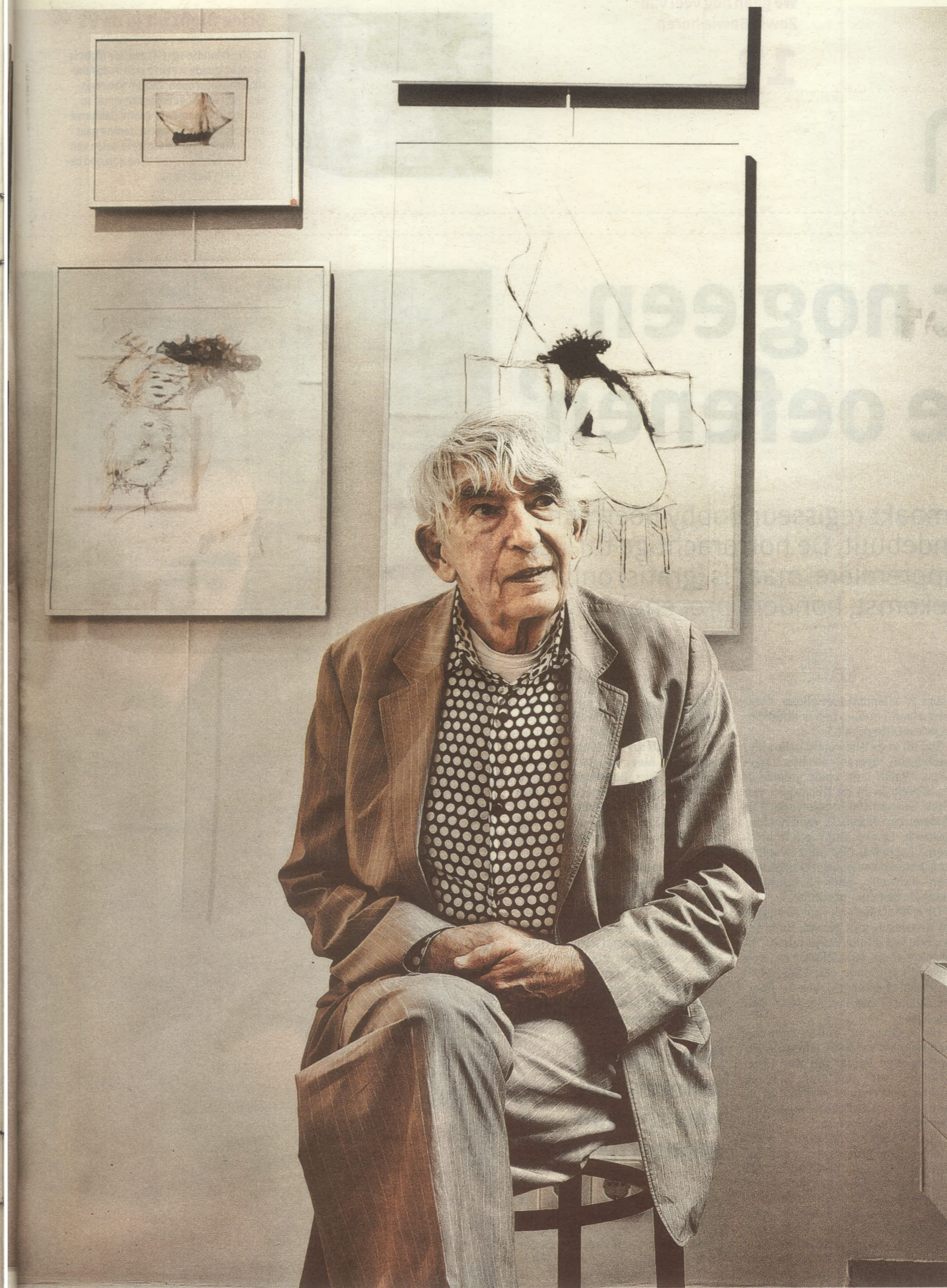
angst omdat ik nog maar één hand had.'

We houden halt bij een ets die hij maakte in Suriname, twee jaar geleden; Fort Hollandia, december